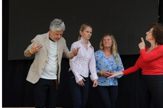
Voila Jelnyelvi Társulat