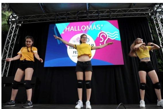
„Move for Vivacity” jászberényi tánciskola növendékei