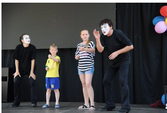
Dvorák Patka Színház

A pantomim igen összetett színházi műfaj, amely képes megteremteni egy láthatatlan világot, kitűnő szórakozás beszéd nélkül. A játék, az együtt nevetés, a képzelőerő, amit ez a műfaj igényel, és a zene vagy éppen a csend mind hozzásegítenek ahhoz, hogy a világot egy kis időre magunk mögött hagyva kikapcsolódjunk, és észrevétlen fejlődjünk.