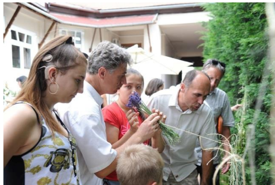
Gyógy és fűszernövény bemutató és illatfelismerés

Napjainkban reneszánszát éli a gyógynövényekkel való foglalatosság. Egyre többen keresik a természetes, vegyszer-és adalékmentes kozmetikumokat, élelmiszereket, gyógyszereket. Az ezekhez a termékekhez nélkülözhetetlen alapanyagoknak kiváló terepet biztosítanak a kedvező adottságú magyarországi tájak. Az illatok és a látvány mellett hasznos ismeretekre is szert tehetnek a téma iránt érdeklődők a bemutató során.