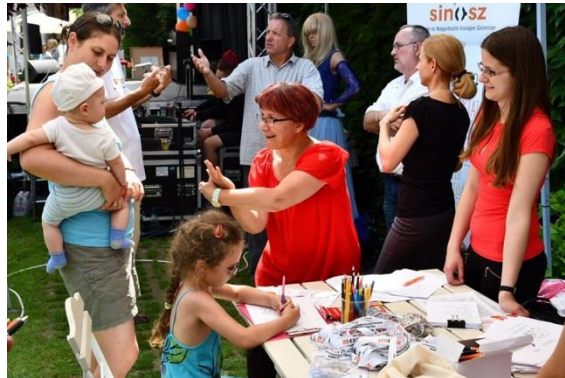
Érzékenyítő óra SINOSZ animátoraival

A színpadi produkciók közötti szünetekben érzékenyítő órára várták az érdeklődőket a SINOSZ animátorai. Ennek segítségével mutatták meg a halló vendégek számára, hogy milyen az élete, a hétköznapjai egy siket vagy nagyothalló embernek.